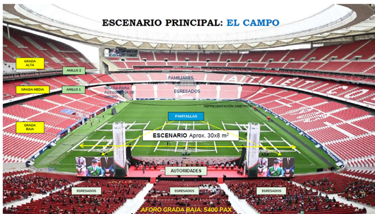
Escenario Principal UPMDay 22

IMPORTANTE: Si por casualidad se diese el caso de que por alguna confusión el nombre del diploma no coincidiese con el del homenajeado nos esperamos a estar en el lateral del campo donde se va a hacer la foto del grupo para cambiarlo con los egresados que salieron en nuestro turno.